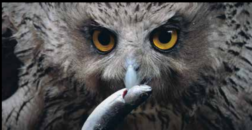
第3回優秀賞「ヤッター」 石原 徹氏(群馬県)

豊かな自然や厳しい環境の中で育まれてきた酪農文化、短い夏を楽しむ各種イベントなど、魅力あふれる東北北海道を広く発信するため、あなたが切り取った、とっておきの瞬間を応募してみませんか？